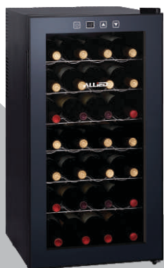
Enfriadora de Vinos Modelo: AL-WF28 Voltaje: 230V - 50Hz Potencia: 70W Capacidad: 28 Botellas